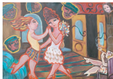
Tango de las cumparsitas - Irene Dominguez